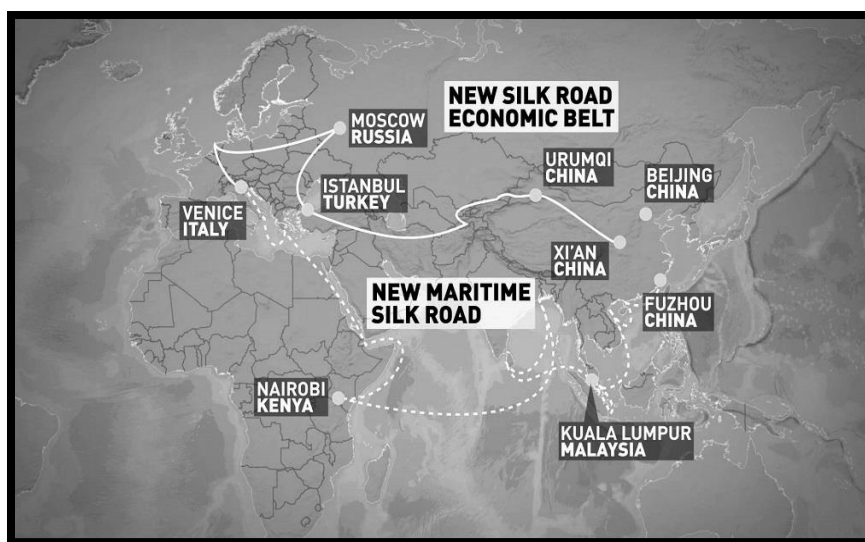
شکل ۲: کمربند اقتصادی جاده ابریشم جدید

در سال‌های اخیر، ایده جاده ابریشم مجدداً احیا شده و اندیشمندان غربی و شرقی طرح‌هایی را برای راه‌اندازی مجدد و گسترش آن ارائه داده‌اند. دو طرح ارائه شده در خصوص جاده ابریشم جدید عبارتند از: «طرح جاده ابریشم آمریکا» که در سال ۲۰۱۱ توسط هیلاری کلینتون مطرح شد و دیگری «طرح جاده ابریشم چین» که شی جی پینگ طی یک سخنرانی در دانشگاه نظربایف قزاقستان در هفتم سپتامبر ۲۰۱۳ مطرح کرد (ملکی و رثوفی، ۱۳۹۵:ص ۲۷-۲۵).